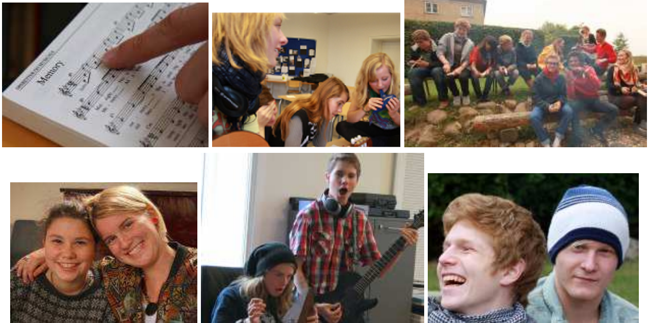
Indtryk fra åbent hus dagen, søndag den 27. september 2009.

I løbet af dagen kom der mange store roser til eleverne – jeres børn - for at præsentere skolen på allerbedste vis. Tænk sig – at man efter kun syv uger som efterskoleelev i Ollerup kan lægge så meget hjerteblood og stolthed i at præsentere deres skole for kommende elever! Her på stedet er vi simpelt hen imponerede over elevernes ildhu. Sådan!