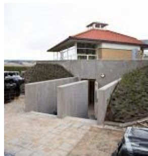
Ny nedgang til køkken