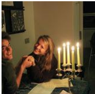
Skal det være os to?

det spændende at følge nogle af de nye konstellationer.