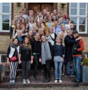
Nogle af jubilarene