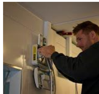
De sidste detaljer

Udvidelsen af skolens køkken er nu færdiggjort, og fredag før efterårsferien blev der hul igennem til den nye tilbygning, der hovedsagelig består af køle- og fryserum samt depoter. I efterårsferien har pedellerne og håndværkere nyindrettet køkkenet. Det giver meget bedre arbejdsfaciliteter og bedre arbejdspladser. Det var en meget glad og tilfreds køkkenleder, der efter ferien viste rundt i alt det nye.