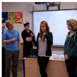
Præsentation af idéerne