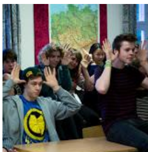
Der lyttes intenst?

En spændende arbejdstitel, og som jeg skrev i sidste nyhedsbrev: Ud af ingenting opstår alting - det store magiske og fantastiske – det sørgmodige og dybtfølte – det sjove og humoristiske. Eleverne skriver ”historier”, komponerer musik, skriver sangtekster, skaber koreografi, bygger kulisser, laver kostumer, sætter lyd og lys og gør scenen klar til såvel de optrædende som til publikum. Efter energiniveauet, idérigdommen og engagementet kan vi godt glæde os til nogle spændende forestillinger.