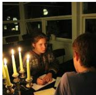
Hvad spiller du?