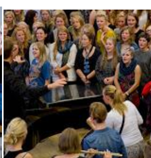
Ih, hvor var der mange