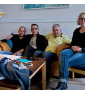
De 4 korledere – klar