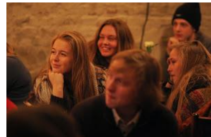
Vi havde selv taget nogle fans med