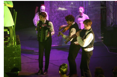
Herlig og fyrig musik

Det var en meget stor glæde, at så mange af jer prioriterede at komme for at se årets musikteater: FOR MEGET . Det blev en forestilling, der til fulde levede op til vore forventninger. Det er meget imponerende, hvad 114 unge mennesker kan få givet udtryk for på bare 10 dage. Mon ikke, der var mange, der gik hjem med noget at tænke over? – og samtidig var fulde af fortrøstning over alt det, de unge sætter fokus på.