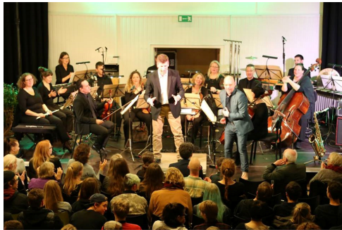
Lyden af Fyn med Odense Symfonietta