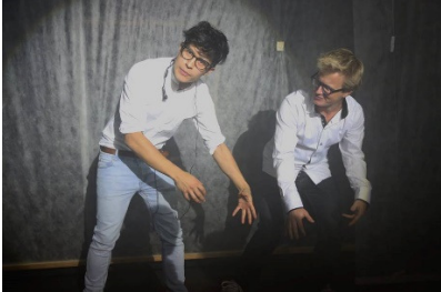
Hvad mon de to nu finder på