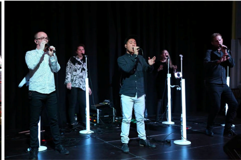
Koncert med Postyr Project