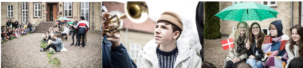
Skønne glimt fra en dejlig dag med kommende elever – de kan kun glæde sig med den velkomst

Lørdag den 30. maj havde vi besøg af de kommende elever. Det blev på mange måder en rørende dag. De nuværende elever gjorde sig stor umage for at tage festligt i mod de kommende elever, vel vidende at det også betyder, at deres eget skoleår går ind i den sidste fase. De tog imod med blomster, sæbebobler, sang og begejstring, de lavede underholdning i spisesalen og på plænen, og de sang med på den flerstemmige sang i Symfonien.