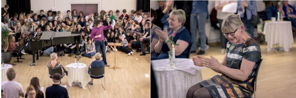
Dagens hovedpersoner i centrum