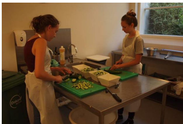
Aktivitet i studiet og i køkkenet - hverdagsbilleder