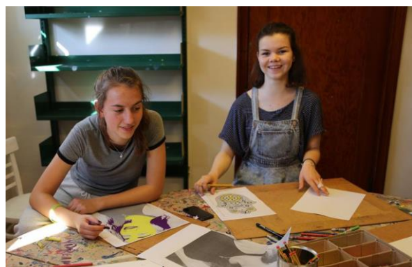
Kreativitet i Billedkunst – Åbent Hus