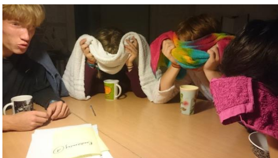
Pebermynteoliedampbad – efter kordag

Tak for jeres opbakning til forældresøndagen, dejligt at så mange prioriterede at sætte dagen af til samvær med os og jeres børn. Det sidste punkt vedrørende elevfest gav anledning til en del bekymringer hos nogle af jer. Heldigvis melder både eleverne og nogle af de forældre, der var med til festen, om en velafviklet elevfest med en hyggelig og god stemning. Det er rigtig godt for eleverne, at det gik så godt.