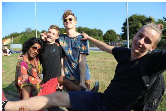
Teambuilding – temadage – sol – varme – skønne tøser – seje gutter