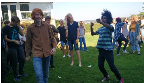
Lunch Beat – herlig stemning