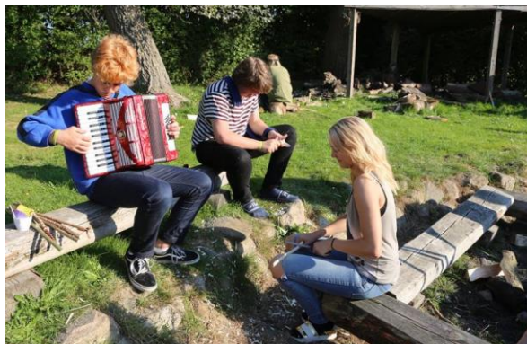
Stemning fra bålpladsen – Åben Hus