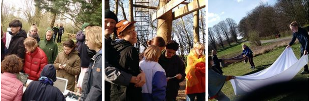
Billeder fra påskedagsaktiviteterne med masser af udendørsleg/øvelser